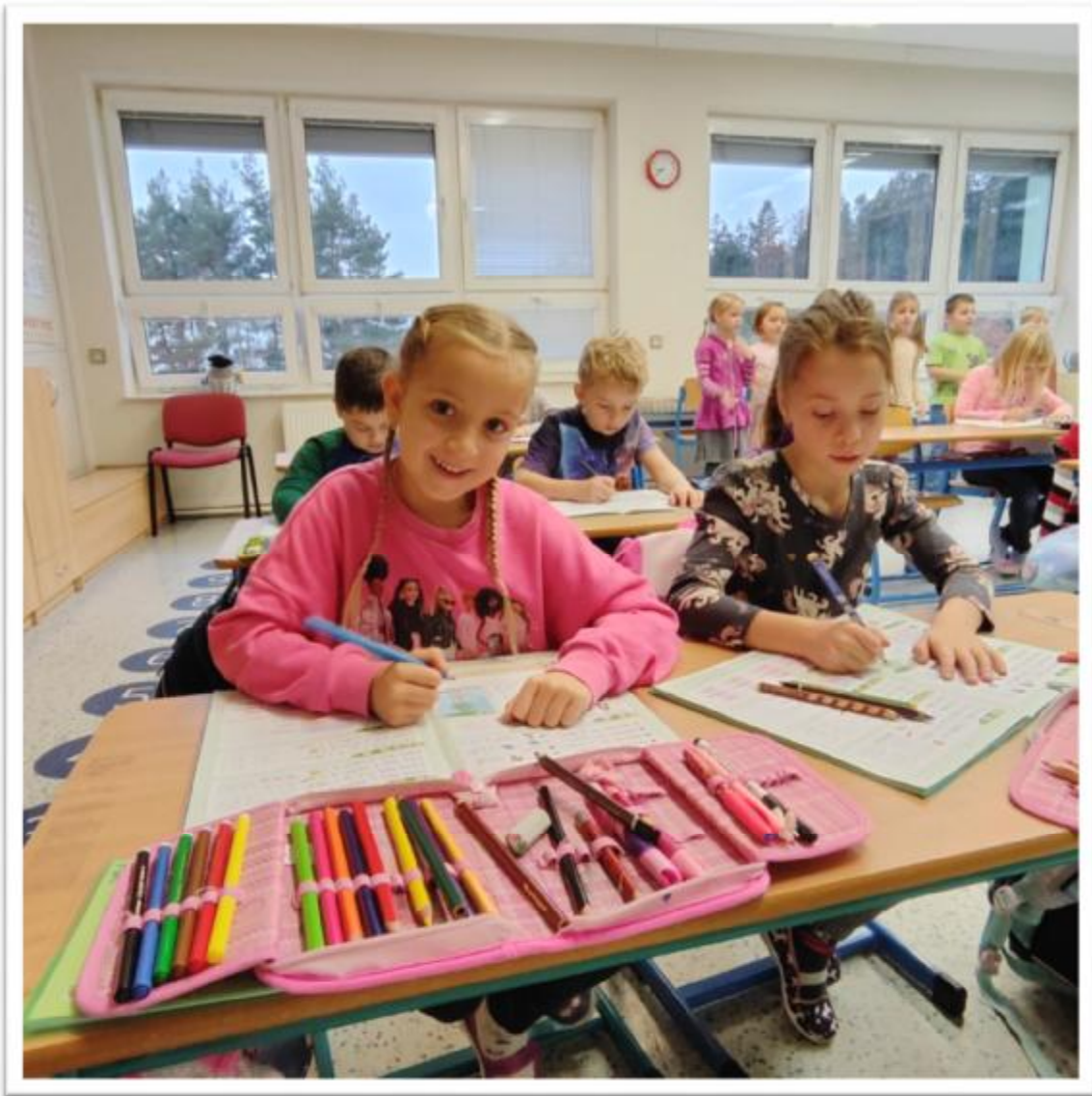
Než nám nástěnky zasněží zimní výzdoba, nahlédněte na tvorbu 3. a 5. třídy – sv. Martin