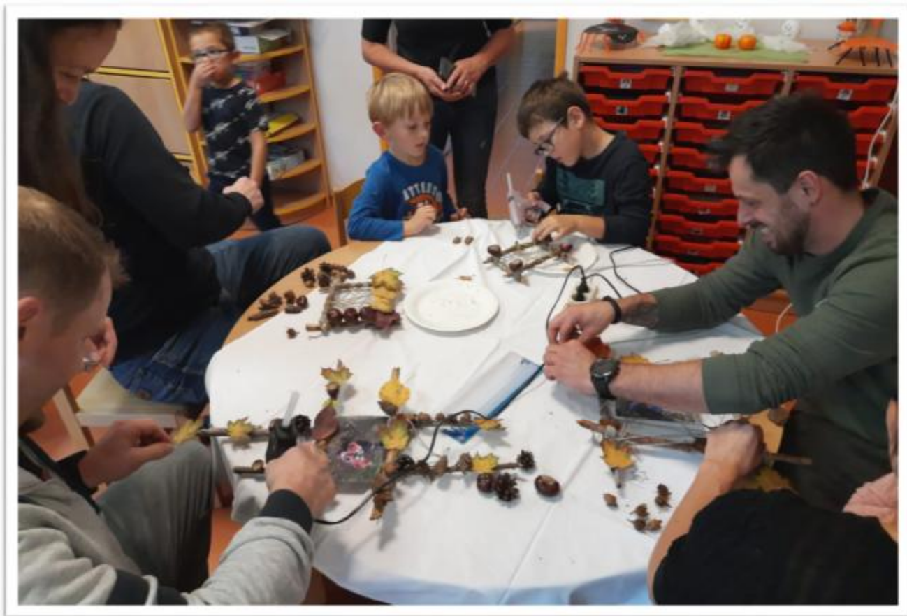
MŠ – vítání občánků