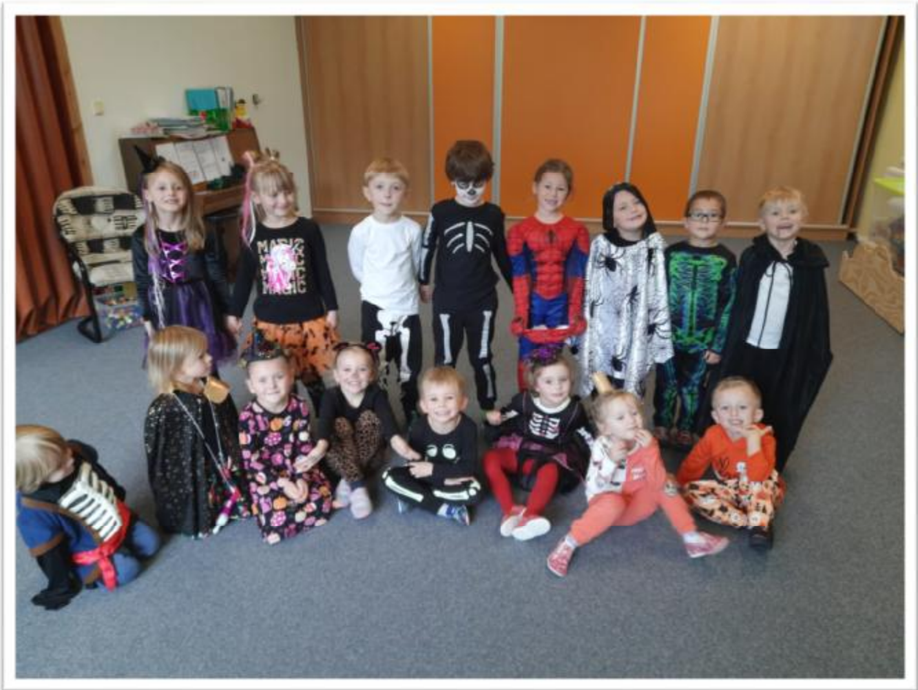
Vysvobození víly Arnošky ze spárů čarodějnice pomocí Halloweenského kouzla se skořicí