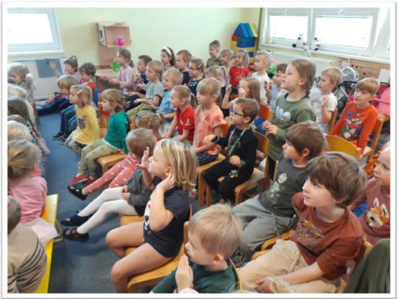
MŠ – lampionový Martinský průvod